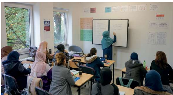
Einige Teilnehmerinnen unserer Hauptschulklasse 9 (2023/2024)