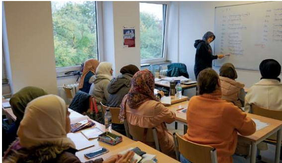
Teilnehmerinnen unserer Klassen (2023/2024) mit ihren Lehrerinnen

Dieser Kurs ist für Frauen mit Migrationshintergrund im Alter von 18 bis 45 Jahren. Voraussetzung zur Teilnahme sind deutsche Sprachkenntnisse auf B1-Niveau. In diesem Kurs werden die Deutschkenntnisse intensiv gefördert und Basiskenntnisse in den Fächern Biologie, Mathematik, Geschichte sowie Berufskunde vermittelt. Die Teilnehmerinnen erhalten Wissen und Unterstützung, um ihren Alltag selbständig zu bewältigen und können bei entsprechender Motivation und Mitarbeit im Folgejahr den Kurs zum Hauptschulabschluss nach Klasse 9 besuchen.