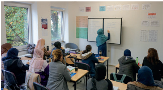
Einige Teilnehmerinnen unserer Hauptschulklasse 9 (2023/2024)