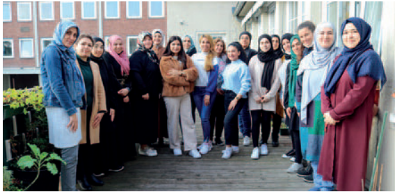
Teilnehmerinnen unserer Klassen (2021/2022) mit Ihren Lehrerinnen

Dieser Kurs ist für Frauen mit Migrationshintergrund im Alter von 18 bis 45 Jahren. Voraussetzung zur Teilnahme sind deutsche Sprachkenntnisse auf A2-Niveau. In diesem Kurs werden die Deutschkenntnisse intensiv gefördert und Basiskenntnisse in den Fächern Biologie, Mathematik, Geschichte sowie Berufskunde vermittelt. Die Teilnehmerinnen erhalten Wissen und Unterstützung, um ihren Alltag selbständig zu bewältigen und können bei entsprechender Motivation und Mitarbeit im Folgejahr den Kurs zum Hauptschulabschluss nach Klasse 9 besuchen.