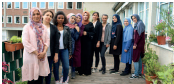
Einige Teilnehmerinnen unserer Hauptschulklasse 9 (2020/2021)